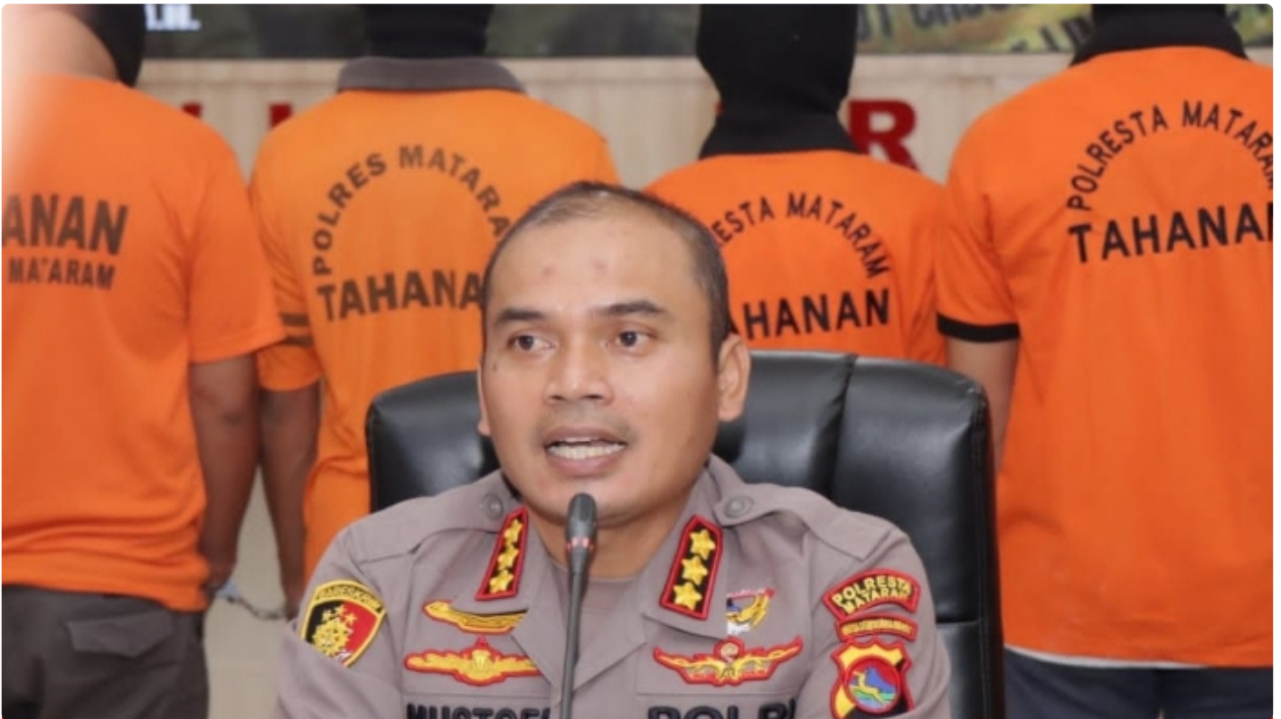
Kapolresta Mataram Kombes Pol Mustofa SIK MH saat konferensi pers, (05/12/2022)

Mataram NTB - Dalam Rangka memelihara situasi keamanan dan ketertiban masyarakat di wilayah Kota Mataram, Polresta Mataram Polda NTB melalui Sat Resnarkoba laksanakan Operasi menjelang Natal dan Tahun Baru (Nataru).